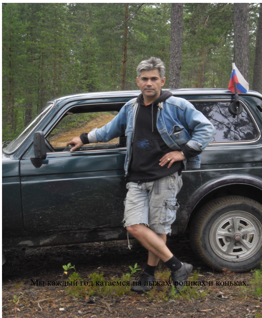
Мы каждый год катаемся на лыжах, роликах и коньках.