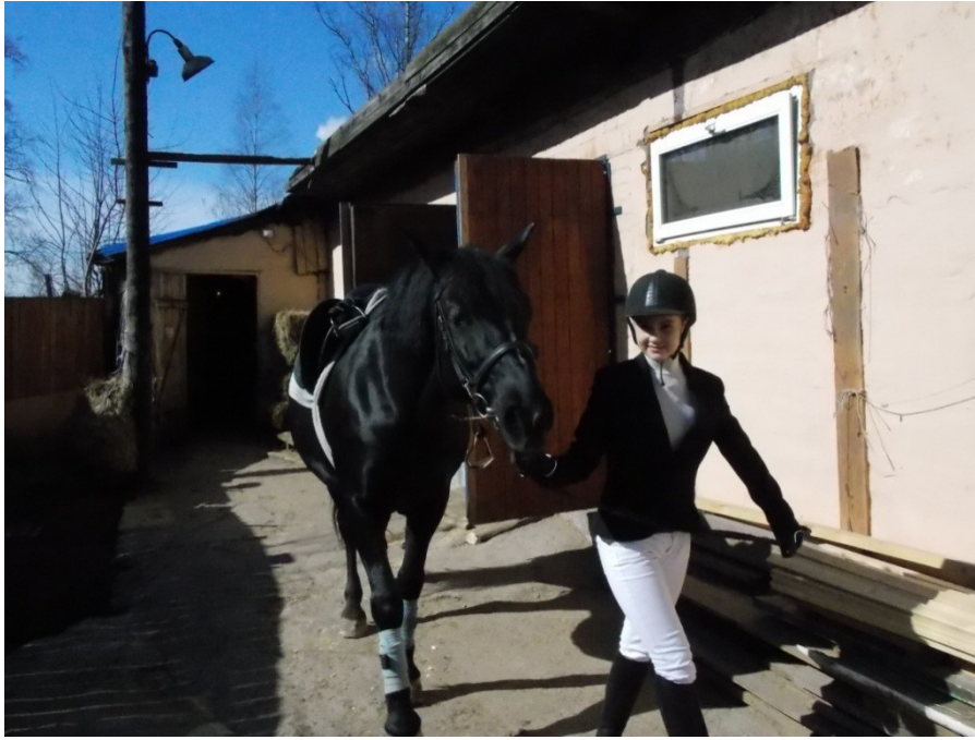
Мы всей семьёй занимаемся скалолазанием.