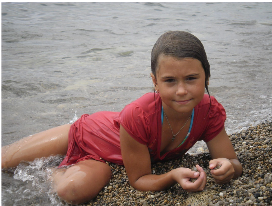
Наша семья принимает участие в гонках «4 на 4».